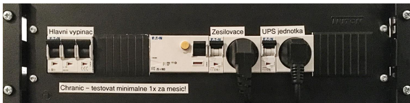
Jednoduché a přehledné řešení rozvaděče elektro, který je součástí stojanu s technikou.